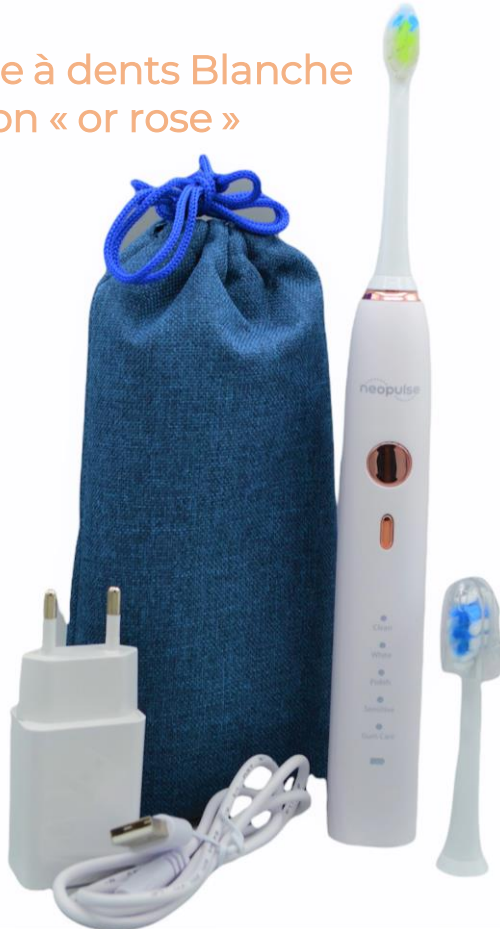
Brosse à dents Blanche Bouton « or rose »

NEW Lancement semaine du 2 Novembre 2021