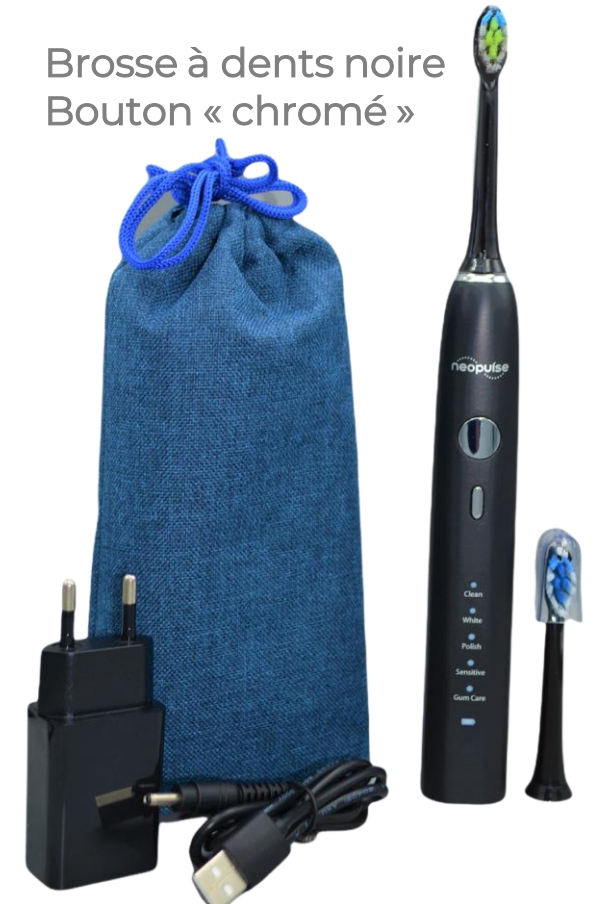
Brosse à dents noire Bouton « chromé »