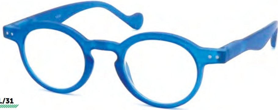
COL/31 FLEX TEMPLE