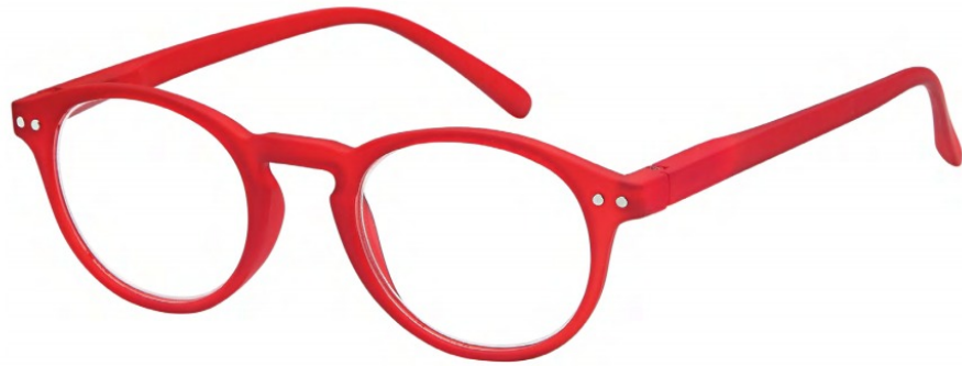
COL/165 FLEX TEMPLE