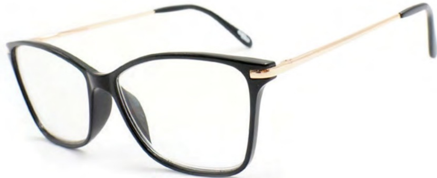
COL/170 ////// NICKEL FREE FLEX TEMPLE