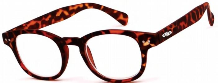
ORD/2 //// FLEX TEMPLE