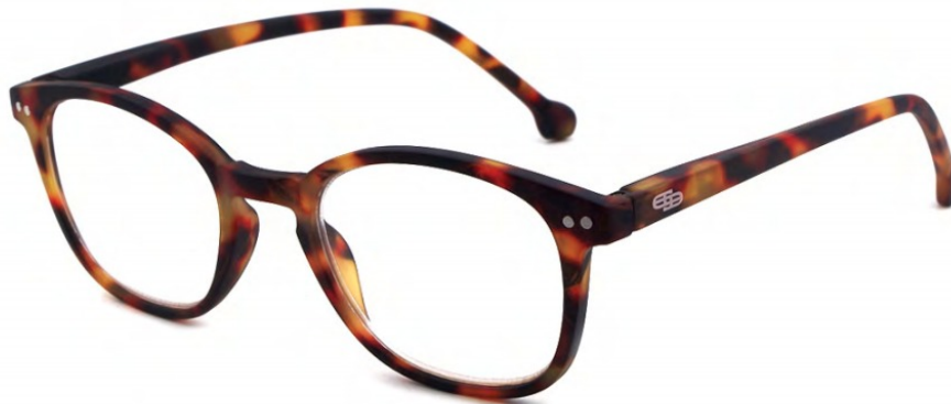
COL/59 FLEX TEMPLE