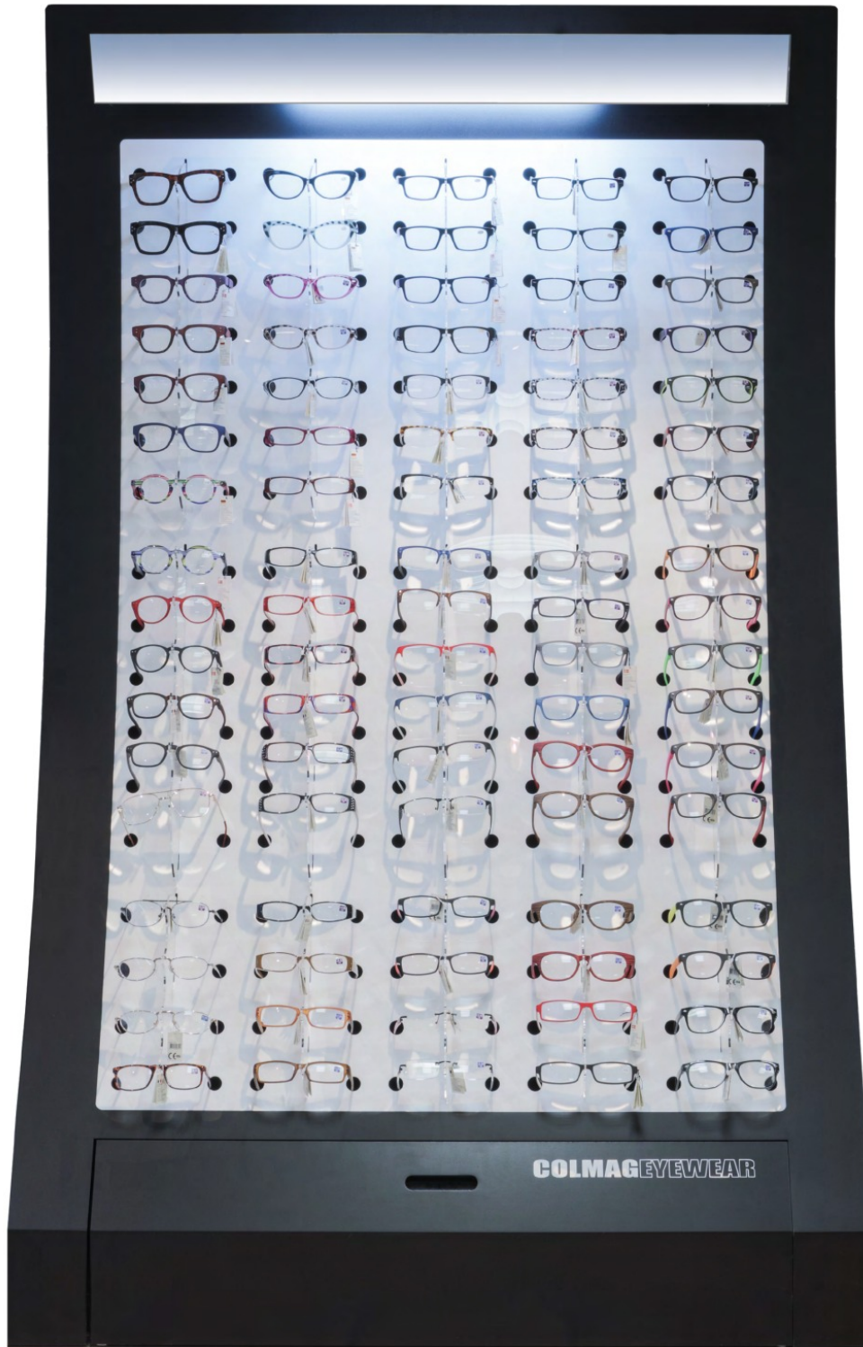
PVC METAL 85 pcs Miroir + éclairage + tiroir 120 x 190 x 40 cm