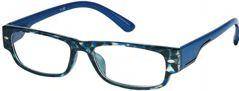
COL/14 FLEX TEMPLE