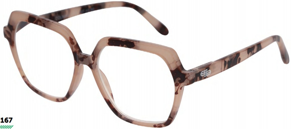
COL/167 FLEX TEMPLE