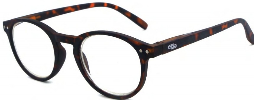
COL/60 FLEX TEMPLE