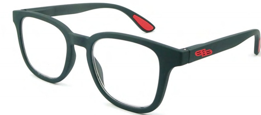
COL/53 ////// FLEX TEMPLE