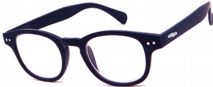
ORD/1 //// FLEX TEMPLE