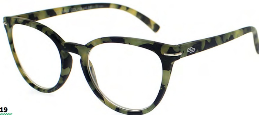
COL/19 FLEX TEMPLE