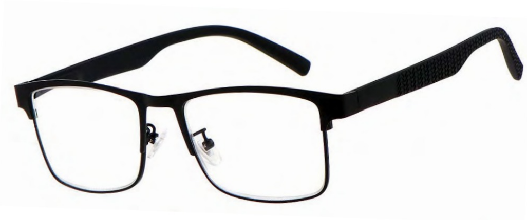
M119 NICKEL FREE FLEX TEMPLE