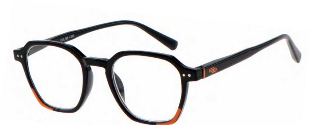
COL/63 FLEX TEMPLE