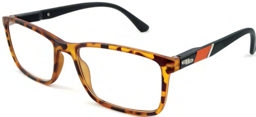
COL/40 FLEX TEMPLE