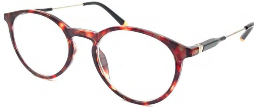
COL/55 NICKEL FREE FLEX TEMPLE