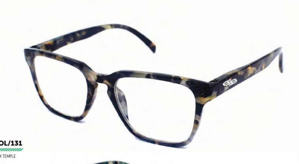
COL/131 FLEX TEMPLE