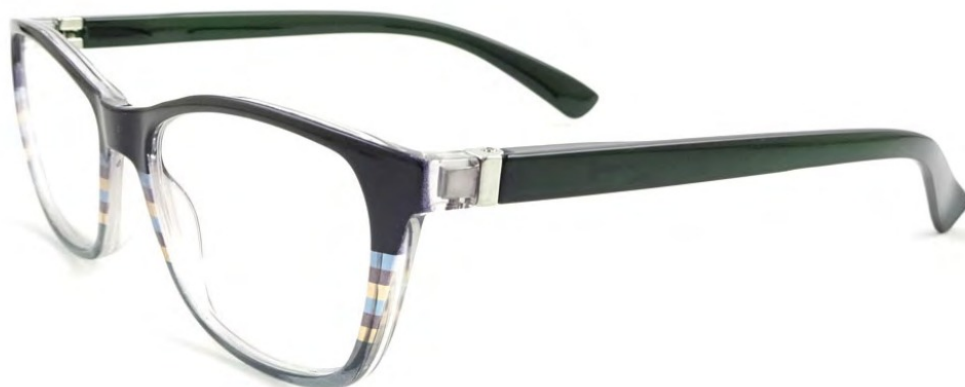
COL/33 //// NICKEL FREE FLEX TEMPLE