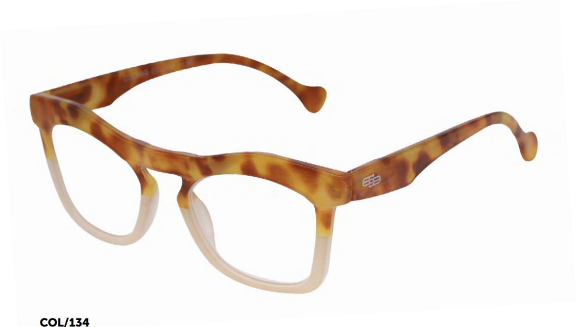
COL/134 FLEX TEMPLE