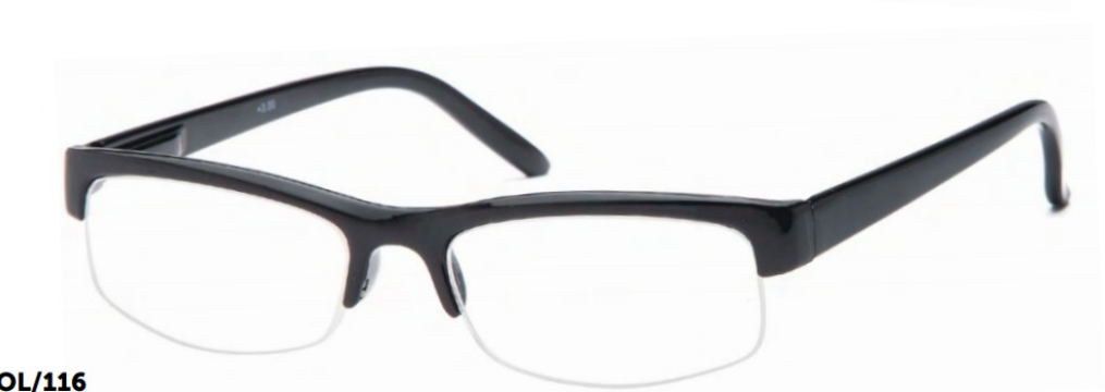
COL/116 FLEX TEMPLE