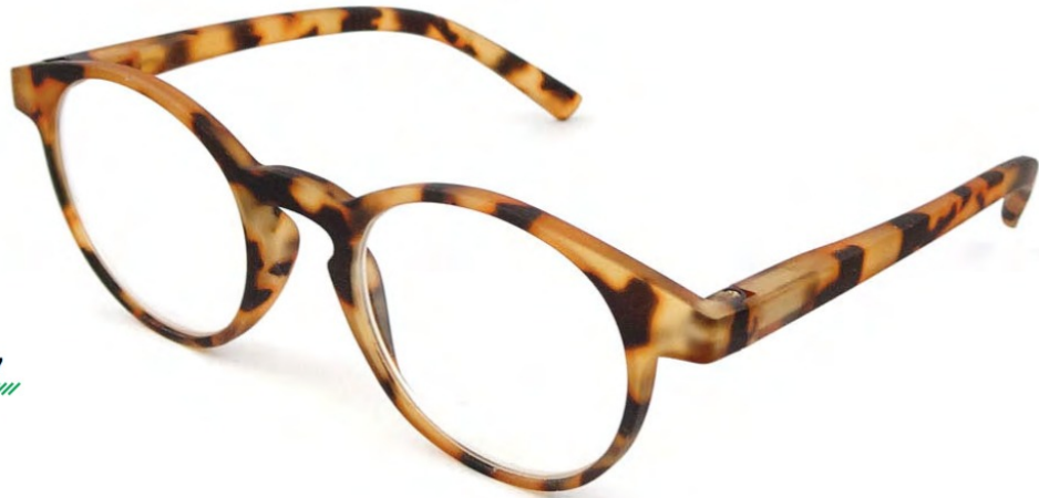
COL/37 FLEX TEMPLE