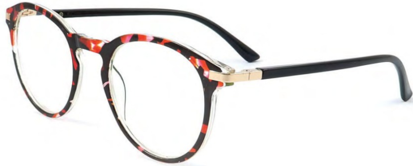
COL/58 NICKEL FREE FLEX TEMPLE