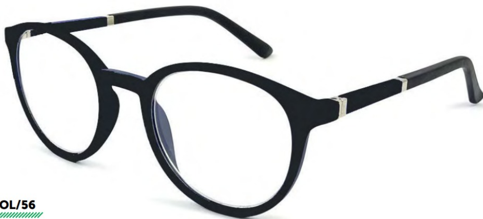
COL/56 NICKEL FREE FLEX TEMPLE