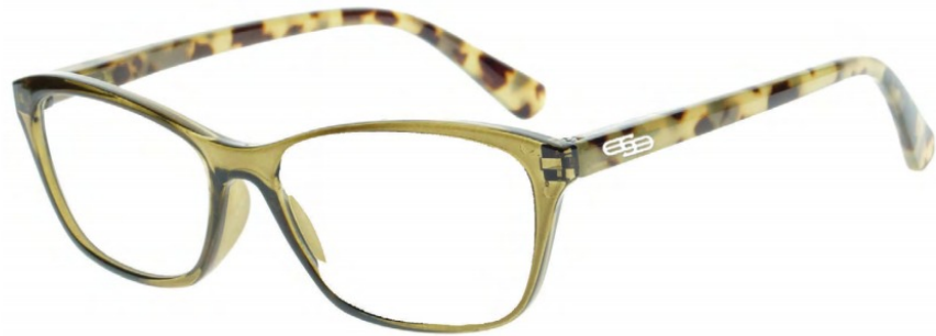
COL/47 FLEX TEMPLE