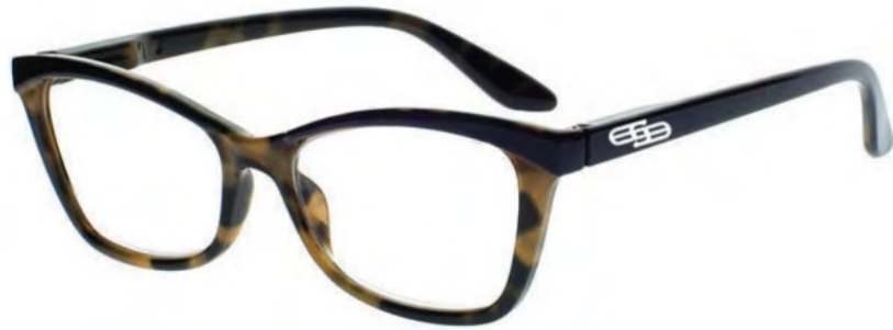
COL/46 FLEX TEMPLE