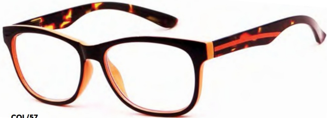
COL/57 FLEX TEMPLE