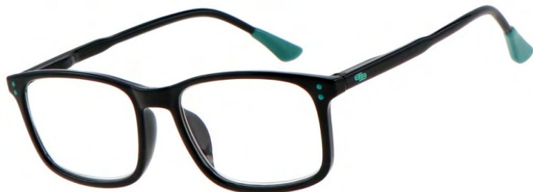
COL/62 FLEX TEMPLE