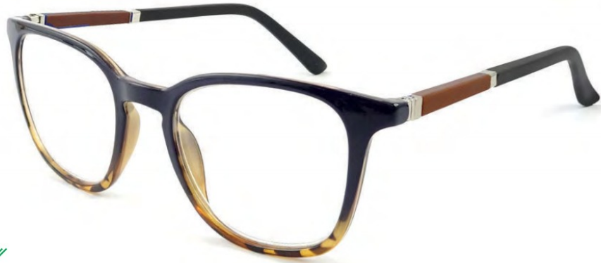
COL/54 NICKEL FREE FLEX TEMPLE