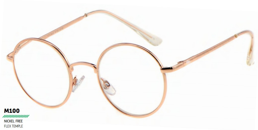
M100 NICKEL FREE FLEX TEMPLE