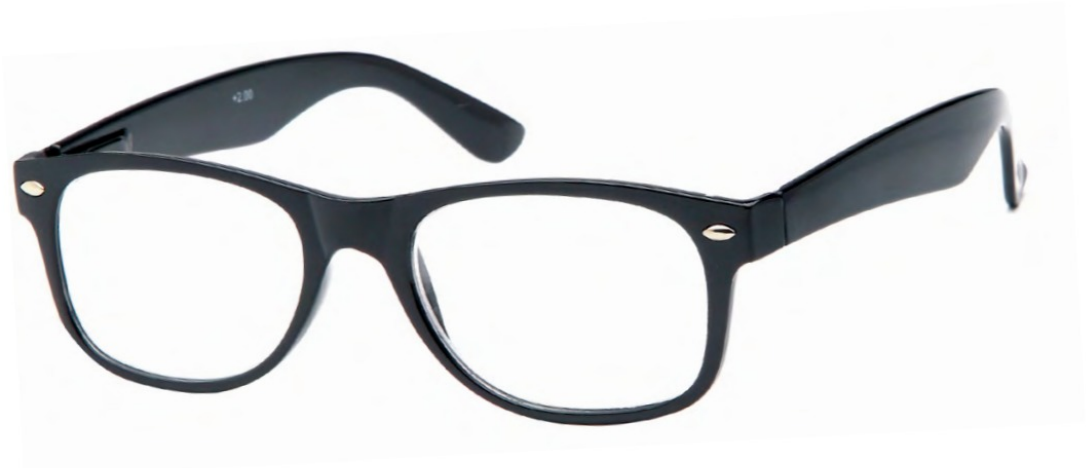
COL/15 FLEX TEMPLE