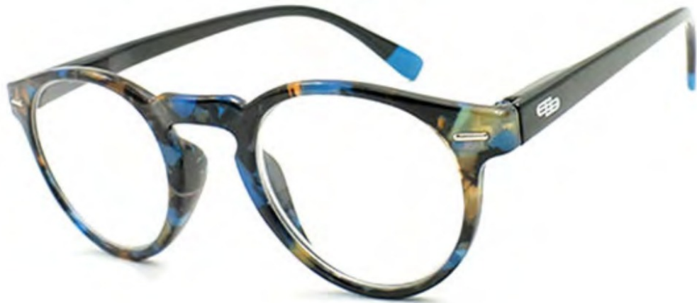
COL/166 ////// FLEX TEMPLE