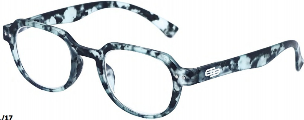
COL/17 FLEX TEMPLE