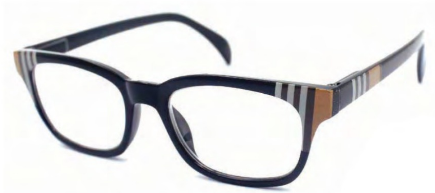
COL/52 ////// FLEX TEMPLE