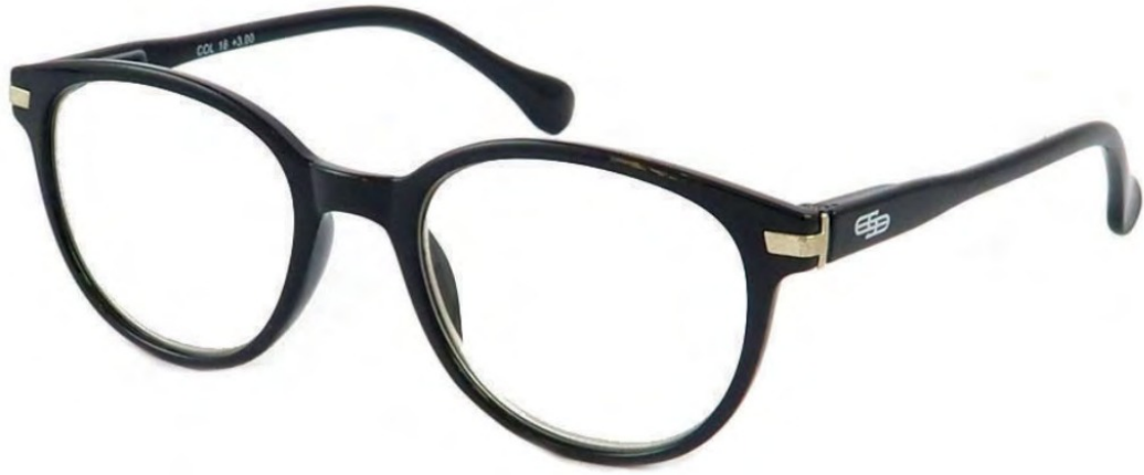
COL/18 FLEX TEMPLE