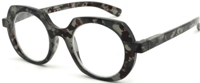
COL/35 FLEX TEMPLE