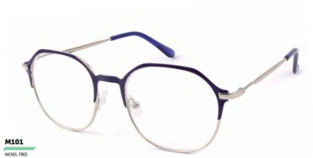
M101 NICKEL FREE