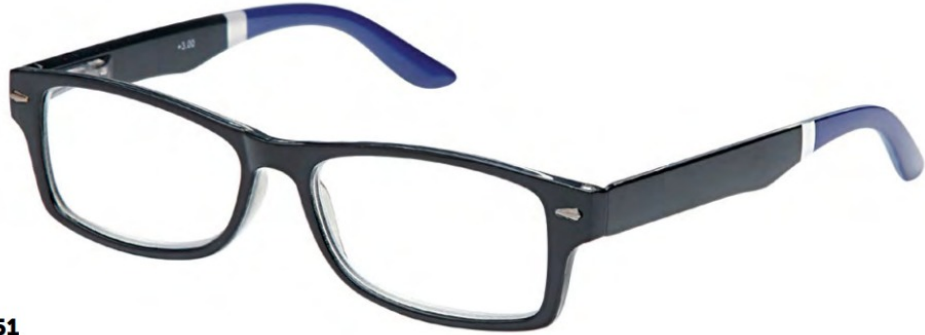
COL/151 FLEX TEMPLE