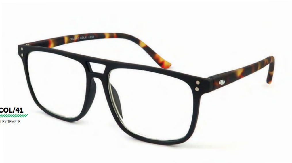
COL/41 FLEX TEMPLE