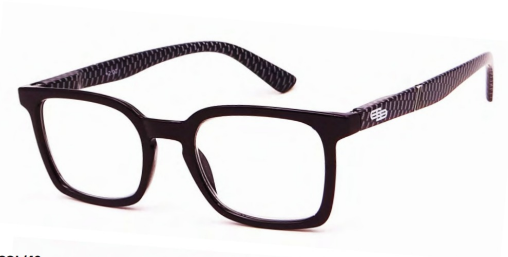
COL/42 FLEX TEMPLE