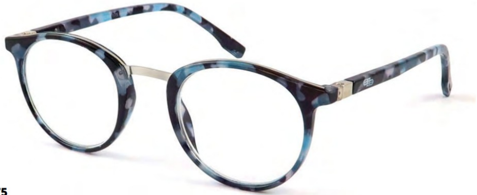
COL/175 ////// NICKEL FREE FLEX TEMPLE