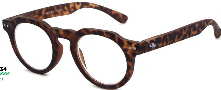
COL/34 FLEX TEMPLE