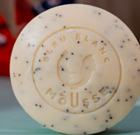
Savon exfoliant au pavot

La gamme de savons naturels en forme de palets sont des produits de haute qualité pensés pour les peaux sensibles et respectueux de l'environnement.