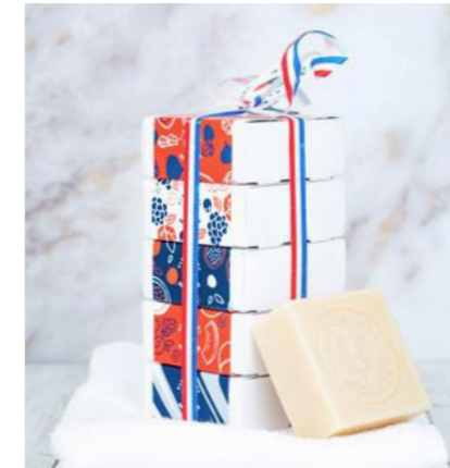
Pack 05 - Classique

Parfums : café, verveine, naturel, ylang & pavot