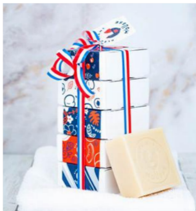
Pack 01 - Classique

Parfums : abricot, naturel, cerise, monoï & melon