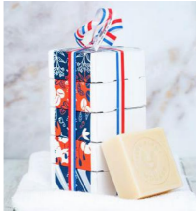
Pack 04 - Classique

Parfums : citron vert, boisée marine, coco, thé vert & lavande