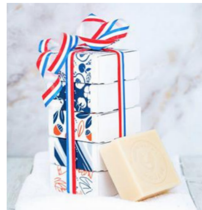
Pack 02 - Ânesse

Parfums : abricot, naturel, cerise, monoï & melon