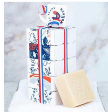
Pack 03 - Classique

Parfums au lait d'ânesse : coton, lotus, karité, naturel & pêche blanche