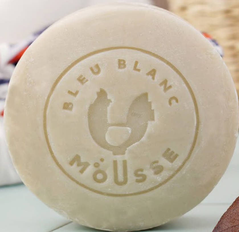
Savon aloé vera